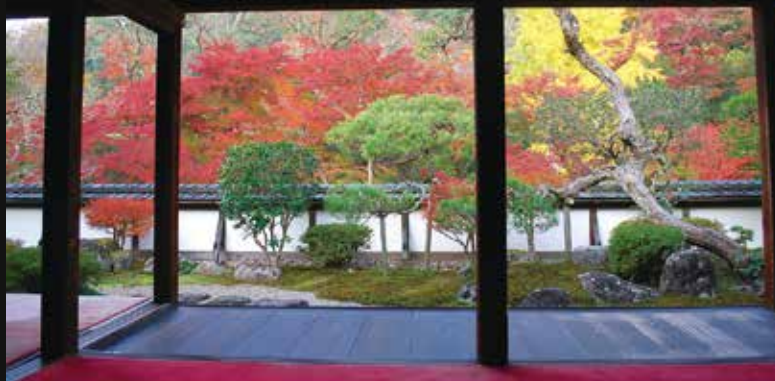
日本で唯一酒造免許を持つ寺「正暦寺」は紅葉の名所でもある

正暦寺は、寺院醸造の中心的役割を担い、菩提酛という革新的な酒造りを確立し、現在の清酒の原点をつくります。古い文献をたよりに菩提酛の酒造り再現プロジェクトが発足し、500年ぶりに菩提酛が復活しました。「清酒のルーツ」と「菩提酛の復活」について3人の専門家が語ります。復活プロジェクトに関わったメンバーの貴重なトークセッションです。